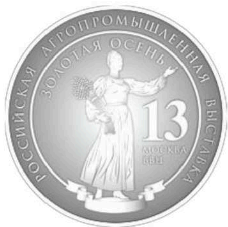
Серебряная медаль выставки «ЗОЛОТАЯ ОСЕНЬ 2013»