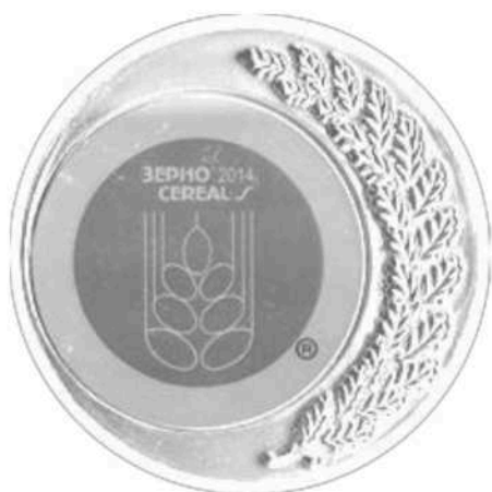
Золотая медаль выставки «ЗЕРНО КОМБИКОРМА ВЕТЕРИНАРИЯ 2014»